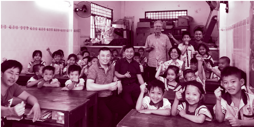
■ Các linh mục Thánh Tâm thăm trường tình thương Hướng Tâm

Việt Nam vẫn được cho là một cánh đồng truyền giáo còn bao la bát ngát. Vì lẽ đó, các anh em dòng Linh Mục Thánh Tâm Chúa Giêsu quyết định chọn đất Việt để thực thi và quảng bá lòng tôn kính Thánh Tâm Chúa Giêsu theo tinh thần yêu mến, đền tạ và dâng hiến cách riêng cho Trái Tim Chúa Giêsu bằng những hoạt động tông đồ thuộc lĩnh vực xã hội và truyền giáo.